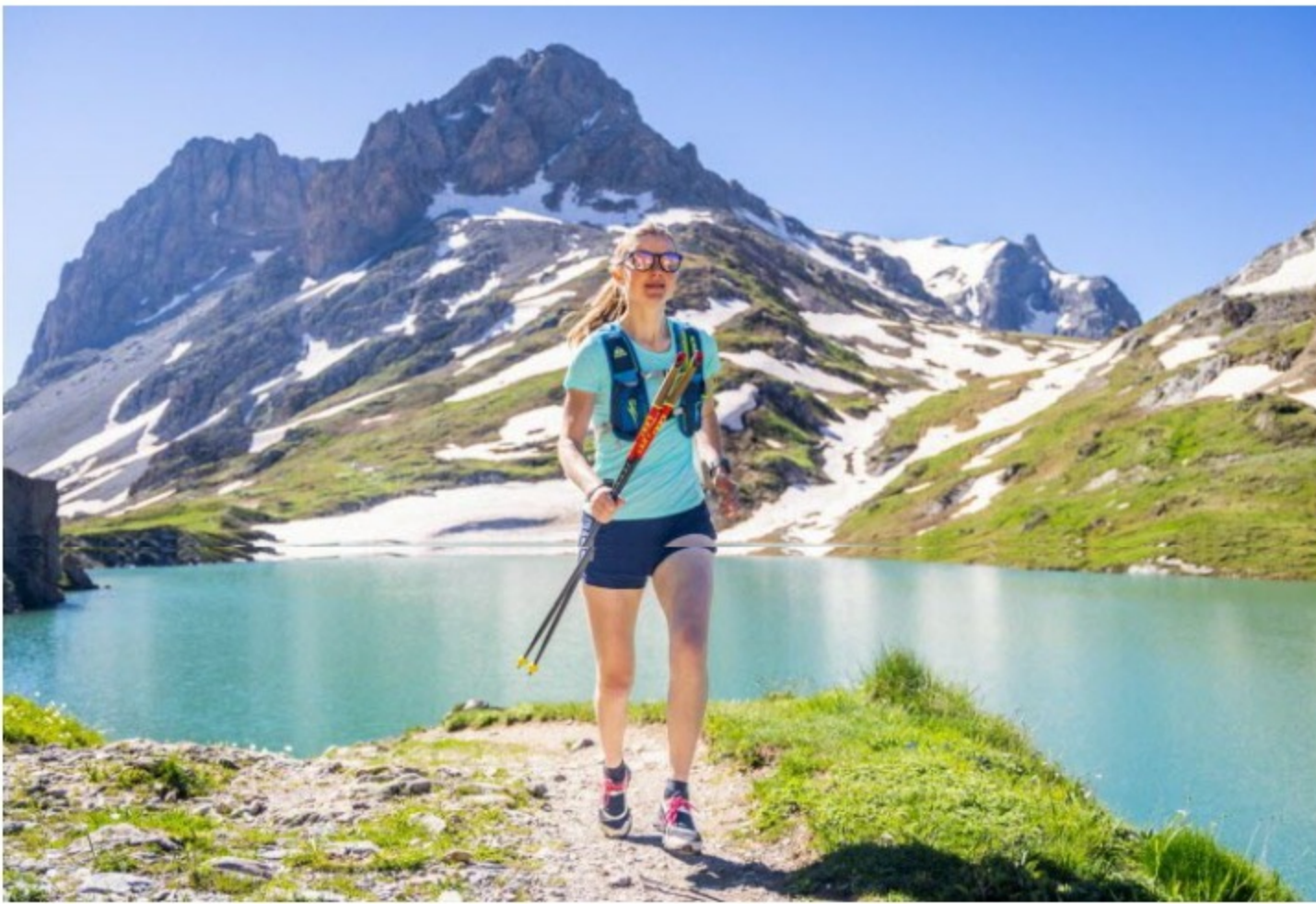
Le lac de la Vieille, à 2 300 mètres d'altitude, sera au cœur du cross triathlon du 6 juillet.

Que ce soit dans les Andes, au Népal, ou encore à la Réunion, les triathlons en haute montagne ne manquent pas. Pourtant Valloire s'apprête à détenir le record de la course la plus haute du monde, pas au niveau de l'altitude maximum, les courses himalayennes restent indétrônables, mais en termes d'altitude pour toutes les épreuves. « Au Népal, le trail monte à plus de 4 000, mais la natation a lieu à 800 », résume Olivier Abdellaoui, organisateur de la course avec l'association Xtria. L'idée de ce triathlon au sommet est née il y a quelques années lors d'une journée de ski dans la station de Maurienne lorsqu'Olivier et d'autres membres de l'association, contemplant le lac de la Vieille à 2 300 mètres d'altitude, s'amusaient à y imaginer une épreuve de natation.